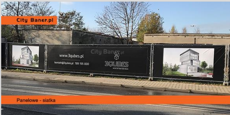
Panelowe - siatka