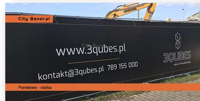
Panelowe - siatka