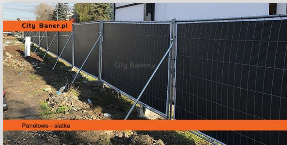
Panelowe - siatka

Gotowe panelowe elementy wypełnione siatką z założonymi banerami. Tył baneru czarny, zapobiegający przenikaniu światła. Pełny koszt obejmuje przęsto ogrodzeniowe wysokości 200 cm, wydruk baneru oraz montaż przęsta i baneru.